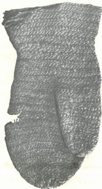
1. mynd. — Vötturinn frá Arnheiðarstöðum. The glove from Arnheiðarstaðir.

þráðurinn lykkjur, sem hægt er að draga úr, svo að allt verkið rakni upp. En í vattarsaumi gengur þráðurinn gegnum þær lykkjur, sem fyrir eru, og er næsta torvelt að draga hann úr aftur. Ef vinnan á ekki að verða úr hófi fyrirhafnarsöm, verður því að notast við