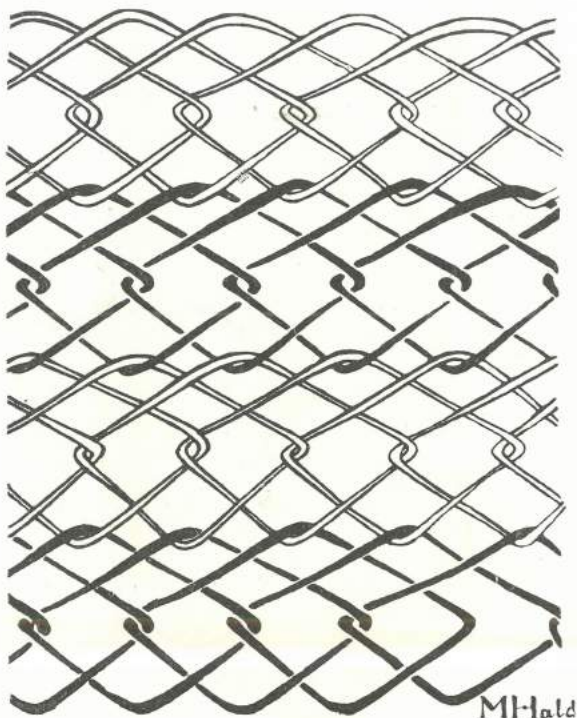
2. mynd. — Greining vinnunnar. — Analysis of the technique.